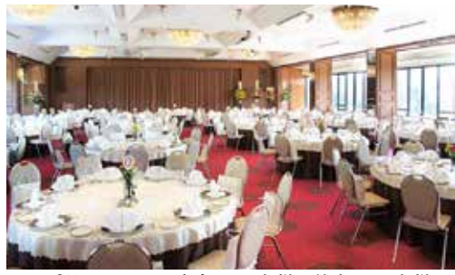
桜の間 立食 600名様 / 着席 320名様 面積 563㎡ / 天井高 4.1m