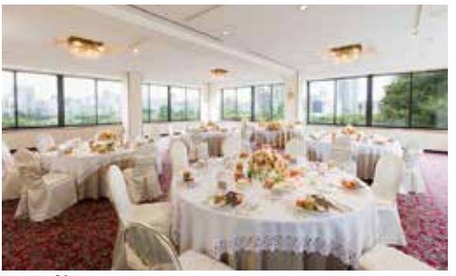
梅の間 立食 80名様 / 着席 60名様 面積 123㎡ / 天井高 3.2m