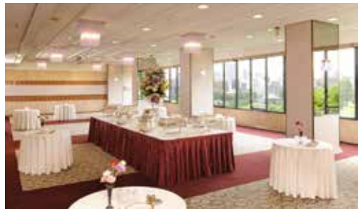
藤の間 立食 150名様 / 着席 100名様 面積 162㎡ / 天井高 3.2m