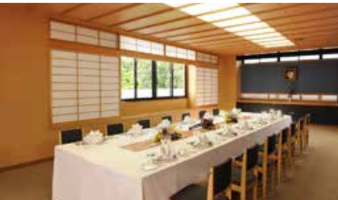
松の間 立食 40名様 / 着席 30名様 面積 68㎡ / 天井高 2.8m