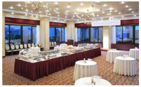
桐の間 立食 150名様 / 着席 110名様 面積 185㎡ / 天井高 4.0m