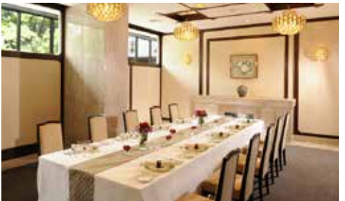
つつじの間 立食 25名様 / 着席 20名様 面積 47㎡ / 天井高 2.9m