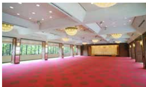
桜の間 立食 600名様 / 着席 320名様 面積 563㎡ / 天井高 4.1m

年代物の美しい調度品に飾られた壮麗なお部屋から、ビジネスシーンにふさわしい落ち着いたお部屋までさまざまな広さやタイプからお選びいただけるご宴会ルーム。晴れやかな祝宴からご法会、カジュアルなパーティービジネスでの交流会や接待などにもご利用いただけます。