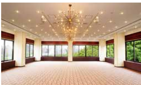
桐の間 立食 150名様 / 着席 110名様 面積 185㎡ / 天井高 4.0m