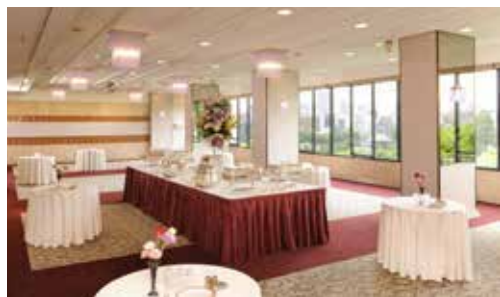
藤の間 立食 150名様 / 着席 100名様 面積 162㎡ / 天井高 3.2m