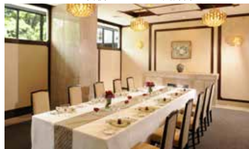
つつじの間 立食 25名様 / 着席 20名様 面積 47㎡ / 天井高 2.9m