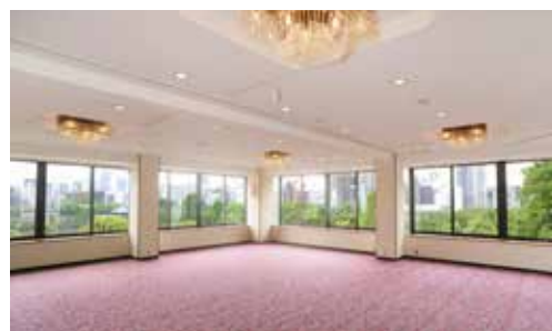
梅の間 立食 80名様 / 着席 60名様 面積 123㎡ / 天井高 3.2m