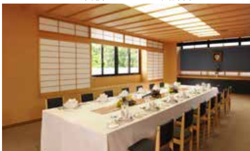
松の間 立食 40名様 / 着席 30名様 面積 68㎡ / 天井高 2.8m